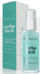
60mL Modeling Serum / Siero modelador

Curlyfix Serum modeler, definer and hold, which prolongs definition, controls frizz and shapes curls.