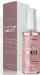
60mL Nourishing Serum / Siero Nutritivo

Nutritious Serum developed with vegetable oils to nourish the hair.