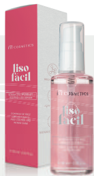
60mL Disciplining Serum / Siero disciplinante

Repairing serum for ends with a blend of silicones. Ideal for daily use, especially for people who are often exposed to the sun.