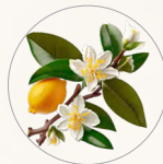
Flor de laranjeira