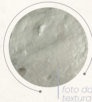
foto da textura